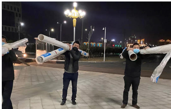
建筑事业部驰援省中医院武东院区工程收尾工作