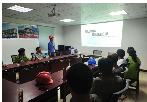
安全管理重点部位讲解

建筑事业部将以这次安全生产月活动为新的起点，进一步加大安全生产监管力度，严格执行各项制度，始终把安全生产放在第一位，常抓不懈，进一步维护良好、稳定、持续的安全生产环境。