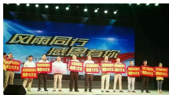
四季花海公司捐资20多万支持英山灾后重建

2020年初的新冠肺炎疫情下，集团及子公司湖北四季花海旅游开发有限公司不忘项目建设的初心，通过爱心捐赠回馈社会，在疫情来袭造成重大经济损失的情况下紧缩开支，共向红十字会捐款超18万。集团投资的英山华美达酒店接待多批次援鄂医疗团队培训和休整，中信仁和人持续为这场防疫攻坚战贡献自己的力量。