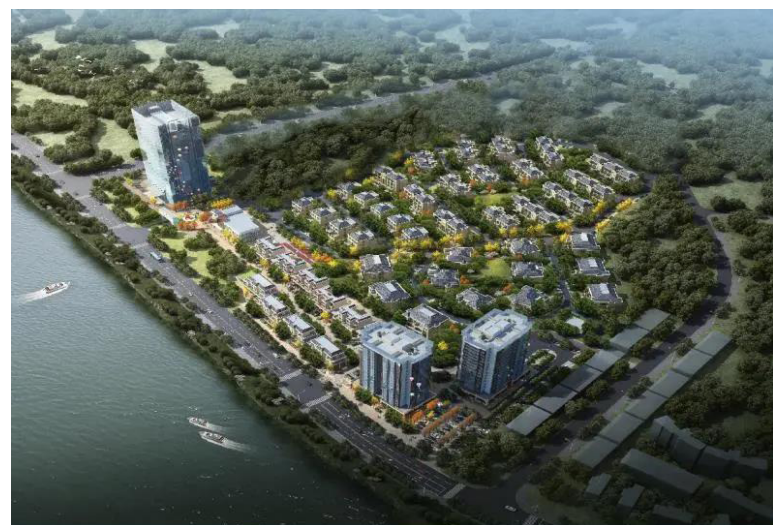
四季花海·旅居新镇项目三期(A区)鸟瞰图

四季花海·旅居新镇项目融入在美丽乡村建设的公益事业中，因地制宜发展生态绿色产业链，不断践行“绿水青山就是金山银山”的理念，完善文旅康养生态链，丰富特色城镇发展内涵，提升产业服务能级化，扩大四季花海·旅居新镇知名度，力争把四季花海打造成全国具有花海及温泉康养度假特色，健康养生高度融合的森林康养基地、文旅特色小镇，为生态文明建设和实现健康中国助力！