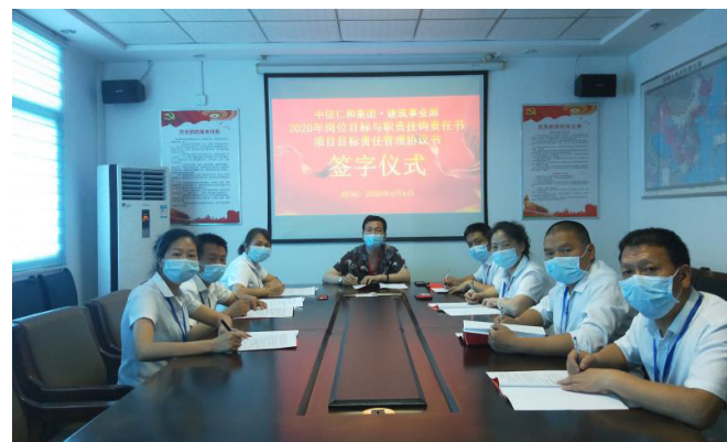
6月6日，建筑事业部主要管理人员《2020年岗位目标与职责挂钩责任书》及新开工项目《目标责任管理协议书》签字仪式顺利进行。