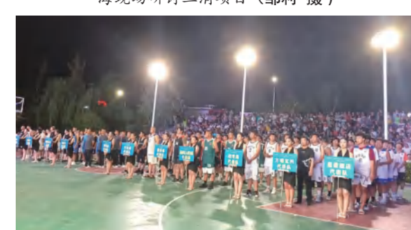
2023年英山县男子篮球联赛在四季花海·九龙湾开赛