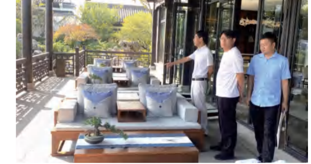
花海置业经理层考察学习红安案例项目