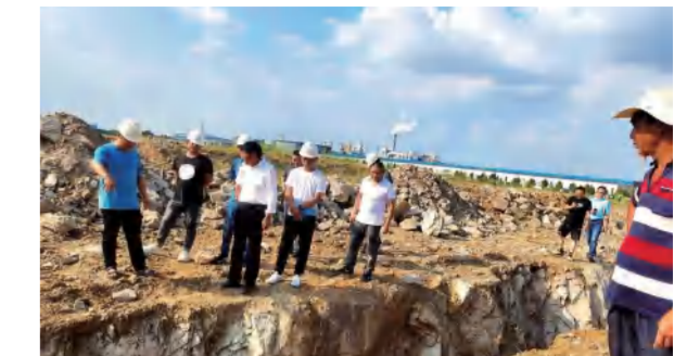
红安泛家居项目4#厂房地基验槽