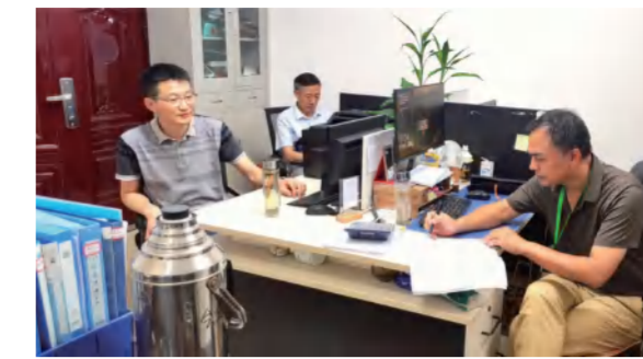
集团督查组在四季花海酒店分公司现场督促