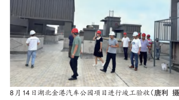
8月14日湖北金港汽车公园项目进行竣工验收