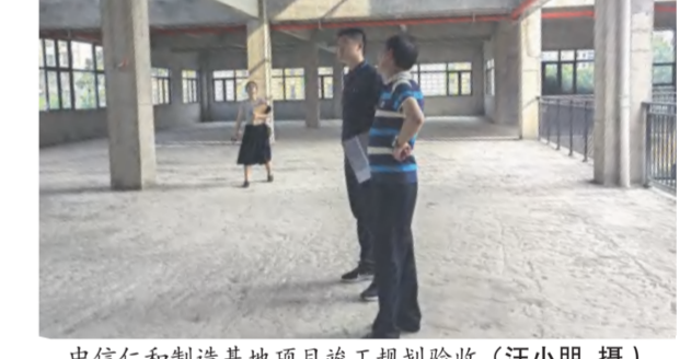
中信仁和制造基地项目竣工规划验收