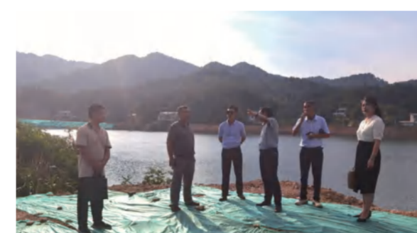
8月18日，县政协、招商局、温泉镇等领导在四季花海现场研讨二消项目