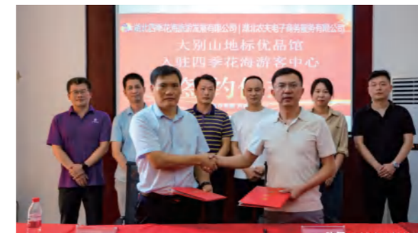
大别山地标优品馆入驻四季花海游客中心签约仪式