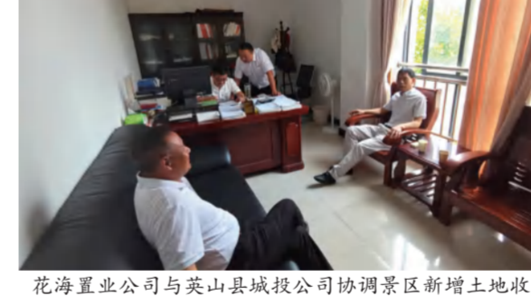
花海置业公司与英山县城投公司协调景区新增土地收储及政府保租房销售工作