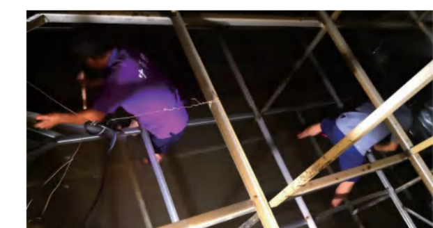
工程人员清洗华美达酒店水箱