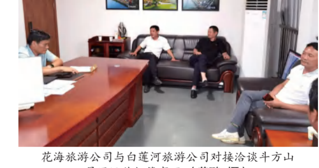
花海旅游公司与白莲河旅游公司对接洽谈斗方山景区运营托管事项