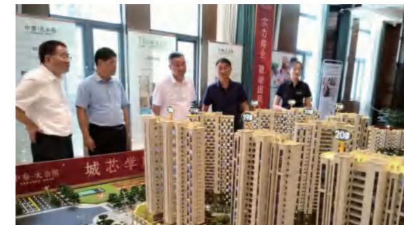
省住建厅及市、县领导在团风·中泰大公馆指导工作