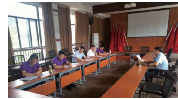
花海旅游公司研讨酒店餐饮创新工作