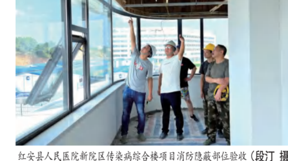
红安县人民医院新院区传染病综合楼项目消防隐蔽部位验收