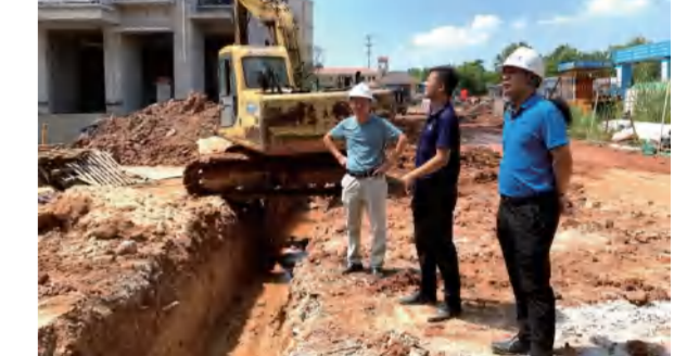
红安泛家居项目4#厂房地基验槽