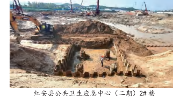
红安县公共卫生应急中心(二期)2#楼塔吊基础施工