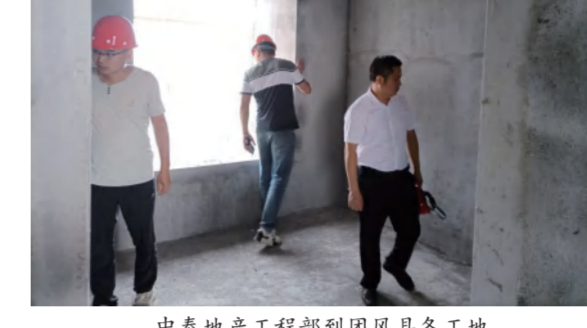
佛山三水政府领导检查云海项目保交楼进度情况