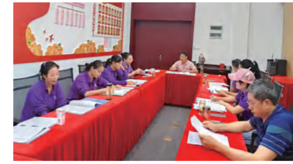
铭先文化公司检查红培团队讲解员业务学习成果