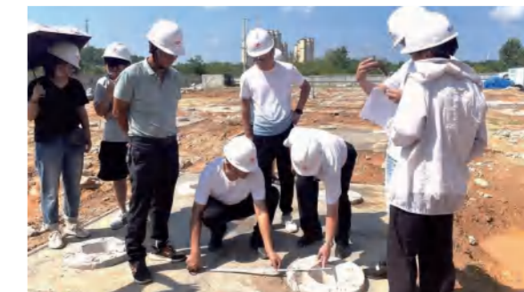
红安泛家居项目4#厂房地基验槽