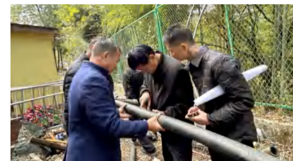
11月22日,花海置业组织现场核实花乐汤温泉前期建设工程管网结算争议事项