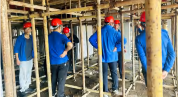
11月4日,建筑事业部各项目主要管理人员在武穴天地项目现场观摩学习