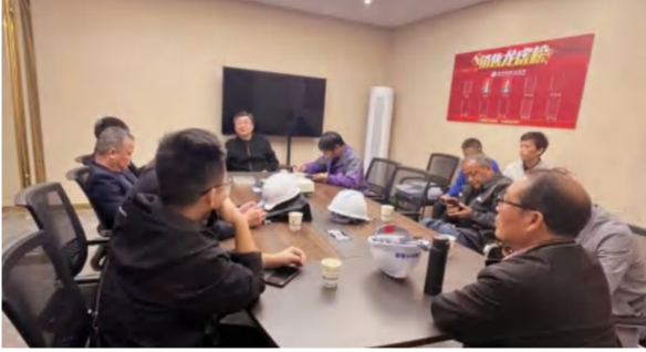
11月8日,四季花海A区项目三组团别墅L16-L21#楼竣工验收会