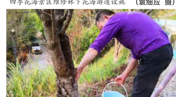
养心苑野奢酒店园内樱花树药物灌根喷雾杀虫