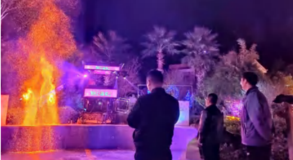
花海旅游总经理赏现场检查浪漫粉红温泉节场景效果