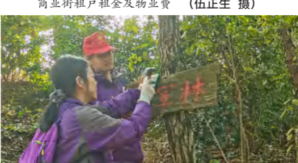
铭先文化公司红培人员进行红色游戏设施维护