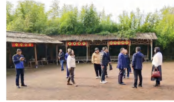
11月29日,英山县多个主管部门在四季花海现场检查督导研学旅行安全