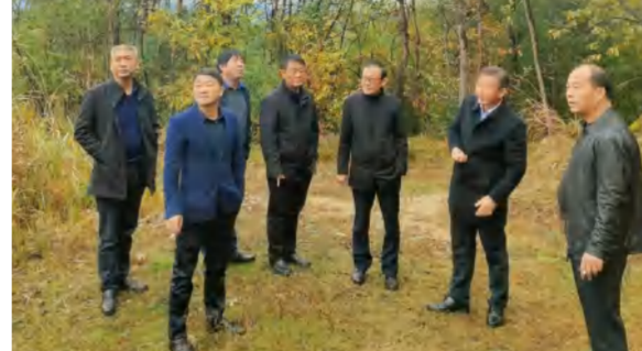
11月25日,花海置业组织有关单位协调会研究九龙湾A03地块坟迁退地事宜