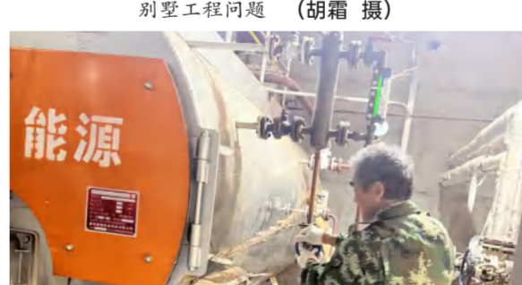
华美达酒店工程部对锅炉进行冬季启用前检修保养