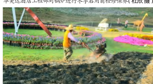
园林工人在四季花海花千谷耕作冬季花地