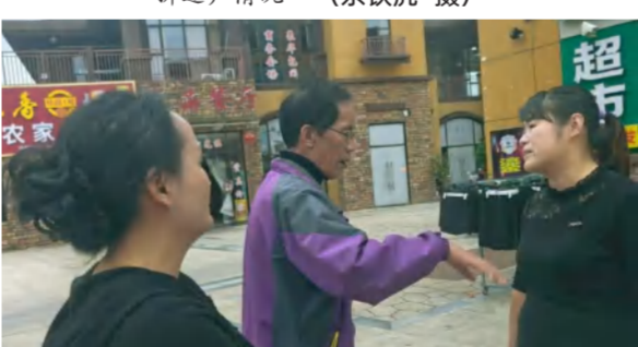
四季花海招商运营中心与六合众物物业公司联合催收商业街租户租金及物业费