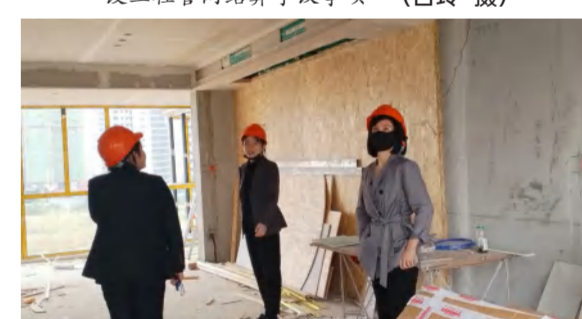
中泰大公馆销售部在贵州长顺售楼部现场调研探讨学习第四代住宅的市场销售情况及客户反响