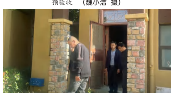
花海置业组织现场研究解决九龙湾C区剩余未售别墅工程问题