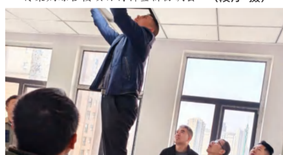
11月21日,黄冈市城建档案馆项目消防工程预验收