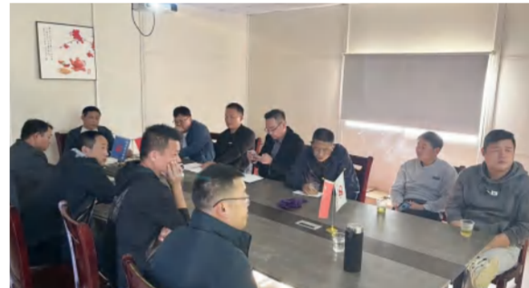
11月21日,建筑事业部召开红安县人民医院新院区传染病综合楼项目材料签价协调会