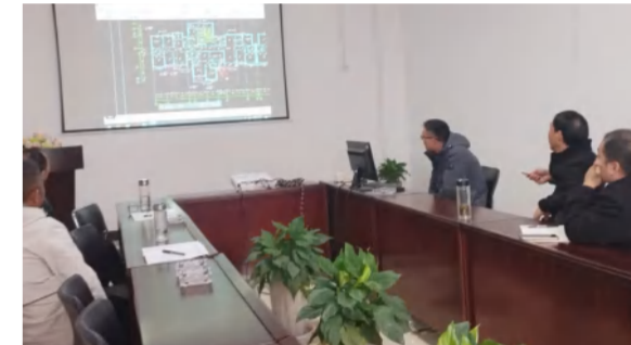
顺民置业工程部认真研究中泰大公馆二期建设优化方案