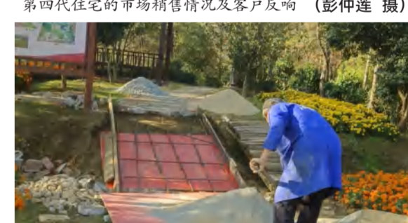
四季花海景区维修林下花海游道设施