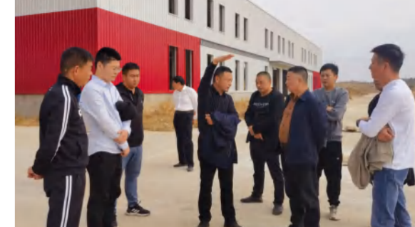
11月8日,泛家居项目甲乙双方现场商讨高压电进场线路事宜