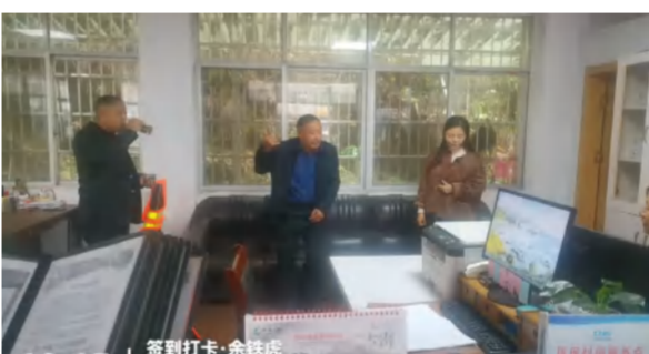
九龙湾营销中心深入南河镇摸底了解英黄高速沿线拆迁户情况